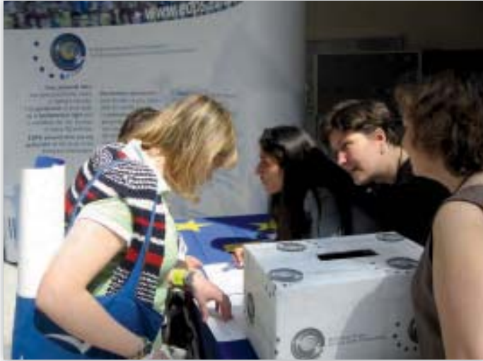
EDAPP personalo nariai prie stendo Europos Parlamente atvirų durų dienos renginyje 2006 m. gegužės 6 d.

Kaip ir 2005 m., dauguma prašymų gauta anglų ir prancūzų kalbomis; tai sudarė sąlygas greitai pateikti atsakymą – beveik visada per 15 darbo dienų. Tačiau nemažai prašymų buvo pateikta kitomis oficialiosiomis kalbomis; dėl kai kurių prašymų reikėjo kreiptis į vertimų tarnybą, todėl jų tvarkymas užtruko ilgiau. Šie prašymai taip pat naudojami kuriant tinklavietės turinį, kad lankytojai galėtų susipažinti ir būtų kuo labiau išvengta nereikalingų užklausų ar skundų.