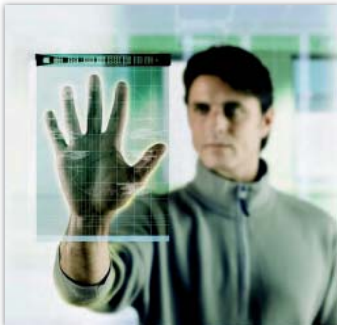
EDAU uzdevums ir arī sekot jaunākajām tehnoloģiju attīstības tendencēm, kas var ietekmēt datu aizsardzību.