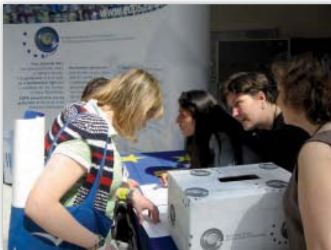
EDAU darbinieki apkalpo stendu Eiropas Parlamenta telpās atvērto durvju dienās 2006. gada 6. maijā.

Lietošanai atvērto durvju dienas laikā, kā arī citiem pasākumiem izveidoja stendu un izstrādāja mazākus reklāmas materiālus (pildspalvas, uzlīmes un USB atmiņas kartes). EDAU stendu uzstādīja Eiropas Parlamentā, un vairāk nekā 200 cilvēku piedalījās viktorinā par datu aizsardzības jautājumiem, kas iedvesmoja pārrunāt privātās dzīves neaizskaramību un datu aizsardzību Eiropā.