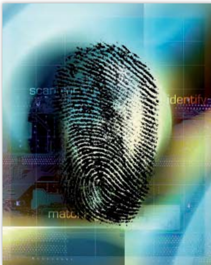
Eurodac sistēmā ir vairāk nekā 250 000 pirkstu nospiedumu.

EDAU ir ņēmis vērā Komisijas publicēto gada ziņojumu par Eurodac darbību (31) un Komisijas publicēto statistiku attiecībā uz sistēmas izmantošanu.