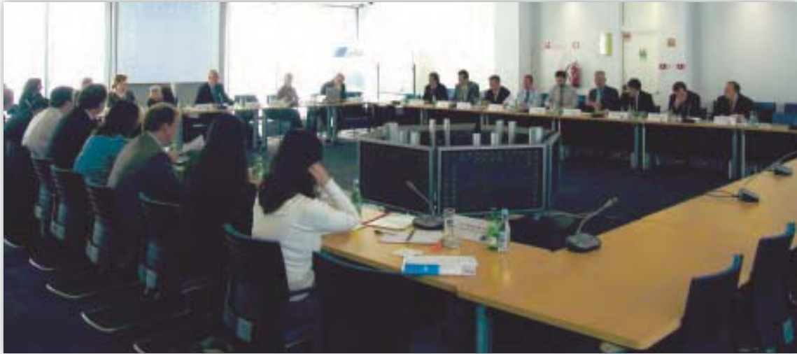
EDAU datu aizsardzības inspektoru tīkla sanāksmē Lisabonā, Portugālē.

EDAU daļēji piedalījās katrā no DAI sanāksmēm, kas notika martā (Tiesa, Luksemburgā), jūnijā ( EMCDDA , Lisabonā) un oktobrī (EDAU, Briselē). Šīs sanāksmes EDAU bija laba iespēja iepazīstināt DAI ar savu darbu un apspriest kopējām interesēm atbilstīgus jautājumus. EDAU izmantoja šo forumu, lai izskaidrotu un apspriestu iepriekšēju pārbaudes procedūru un dažus no galvenajiem jēdzieniem Regulā par iepriekšēju pārbaudes procedūru (piem., “personas datu apstrādātājs”, “apstrādes darbības”). Tas arī deva EDAU iespēju norādīt uz sasniegto darbā ar iepriekšējās pārbaudes lietām un sīkāk izklāstīt dažus no atklājumiem iepriekšējās pārbaudēs paveiktā darbā (sk. 2.3. punktu). Šī sadarbība starp EDAU un DAI tādējādi turpinājās ļoti pozitīvi.