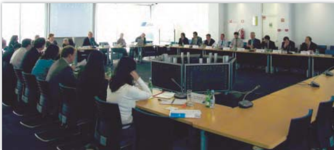
EDPS na zasadnutí siete úradníkov pre ochranu údajov (DPO network) v portugalskom Lisabone.

DPO sa už niekoľko rokov pravidelne stretávajú, aby si vymenili skúsenosti a prediskutovali horizontálne otázky. Z hľadiska spolupráce sa táto neformálna sieť ukázala ako produktívna. Tieto stretnutia pokračovali aj v roku 2006.