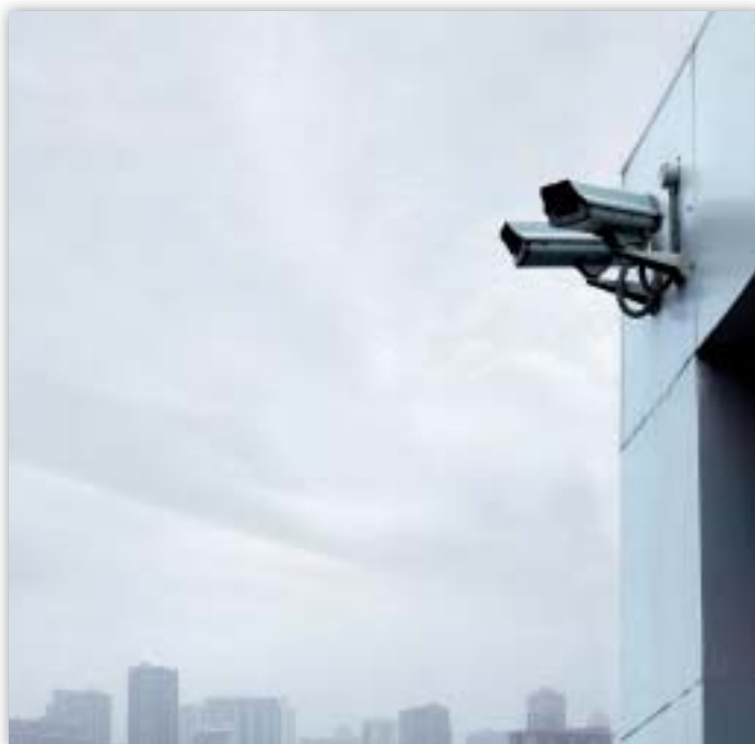
Za posledné roky sa zvýšil počet bezpečnostných kamier.

Na Európsky parlament bola podaná sťažnosť (2006-95) týkajúca sa možného zverejnenia adries bydliska akreditovaných lobistov. Povinnosť uviesť adresu bydliska vyplýva zo žiadosti o elektronický identifikačný preukaz. Nižšie vo formulári žiadosti sa uvádza, že informácie, ktoré nasledujú, nebudú zverejnené, z čoho vyplýva, že informácie, ktoré predchádzali vrátane adresy bydliska zverejnené budú.