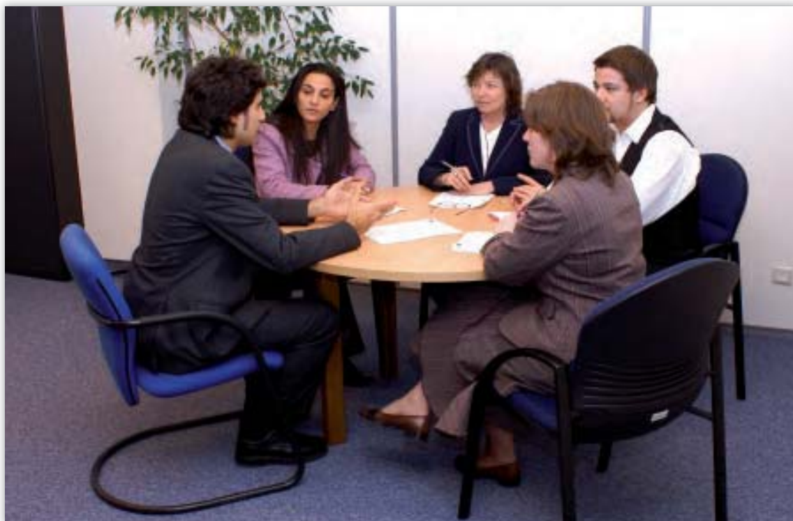
Časť členov tímu pre ľudské zdroje diskutuje o spise.