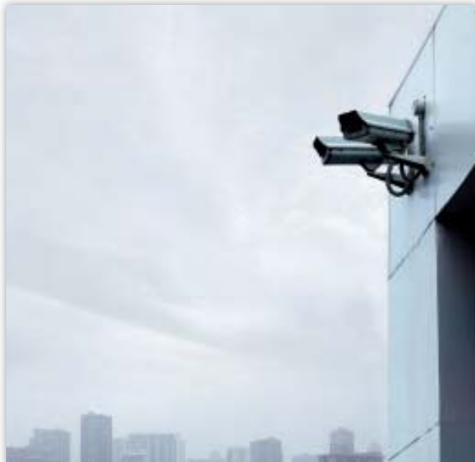
A videokamerás megfigyelések száma növekedett az elmúlt években

Panasz érkezett az Európai Parlamenttel szemben (2006-95) az akkreditált lobbisták lakcímének lehetséges közzétételéről. A lobbista kitűző elkészítéséhez szükséges jelentkezési lapon az szerepelt, hogy a lakcím megadása kötelező. A jelentkezési lapon később említésre került, hogy az említést követő információkat nem hozzák nyilvánosságra, ami azt sugallja, hogy az azt megelőző információkat, köztük a lakcímet, nyilvánosságra hozzák.