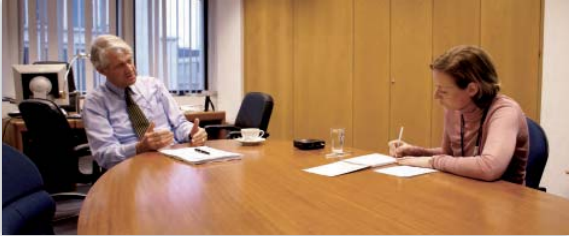
Peter Hustinx interjút ad egy újságírónak