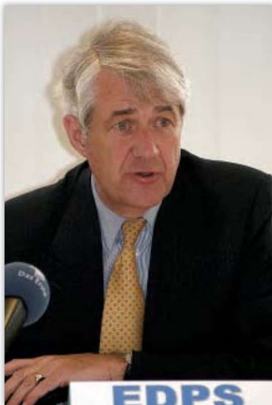
Peter Hustinx egy sajtótájékoztatóján

A 45/2001/EK rendelet 46. cikke f) pontjának ii. alpontja szerint az európai adatvédelmi biztos együttműködik az EU-szerződés VI. címe alapján („harmadik pillér”) létrehozott adatvédelmi ellenőrző szervekkel abból a célból, hogy javítsa az „egységességet azon szabályok és eljárások alkalmazása terén, amelyek érvényesülésének biztosítása e szervek feladata”. Ezek az ellenőrző szervek a schengeni közös ellenőrző hatóságok, az Europol, az Eurojust és a váminformációs rendszer (VIR). E szervek nagy része a nemzeti felügyelő hatóságok – általában ugyanazon – képviselőiből áll. A gyakorlatban az együttműködés a megfelelő közös ellenőrző hatósággal folyik, amit a Tanács közös adatvédelmi titkársága segít, valamint általánosabb értelemben a nemzeti adatvédelmi tisztviselőkkel.