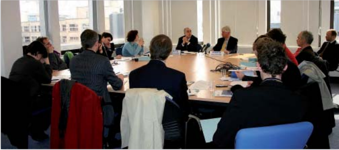
Peter Hustinx és Joaquín Bayo Delgado a 2005. évi jelentést ismerteti egy sajtókonferencián

bővült, valamint jelentősen nőtt a letölthető dokumentumok száma. 2005 őszére érezhető volt, hogy lassan eléri természetes korlátait. Ezért projekt indult a második generációs honlap elkészítésére, és a 2006-os év egészében folyt az ezzel kapcsolatos munka. Teljesen új – a három fő feladat köré csoportosított – szerkezetet és új vizuális megjelenítést dolgoztak ki. Az előkészítő tanulmányokba és a kidolgozásba alvállalkozót vontak be, szoros együttműködésben az Európai Parlamenttel. A második generációs honlap az eredeti tervekhez képest némi késéssel, 2007 februárjában vált elérhetővé. 2007 folyamán további funkcionálisok kifejlesztésére kerül sor.