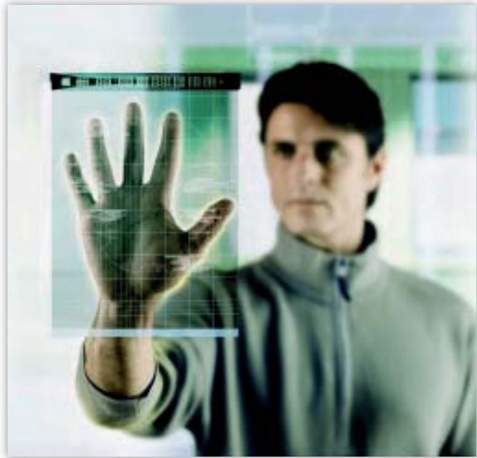
Az adatvédelmere kiható új technológiai fejlemények figyelemmel kísérése az európai adatvédelmi biztos küldetésének részét képezi

Ezen első tapasztalatok alapján az európai adatvédelmi biztos több modellt is ki fog dolgozni a hetedik kutatási keretprogram célzott kutatási programjaihoz való hozzájárulásra. Tervezi a végrehajtott módszerekkel vagy az elért eredményekkel kapcsolatos vélemények kiadását is. A hetedik kutatási keretprogram kutatási programjai általában olyan kötelezettséget tartalmaznak, hogy azokban számos tagállamból érkező partnernek kell részt vennie. Az európai adatvédelmi biztos ebben az esetben is hozzá tudna járulni a programokban részt vevő, megfelelő adatvédelmi hatóságok közötti együttműködéshez.