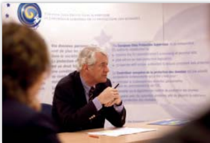
Peter Hustinx egy értekezleten a munkatársakkal

A tematikus terv nyomós indokul szolgál az európai adatvédelmi biztos tanácsadói szerepe kibővítésének szükségessége kapcsán, ami 2006 nyaráig nagyrészt a szabadságon, a biztonságon és a jog érvényesülésén alapuló térséghez kapcsolódó, a vonatkozó bizottsági Főigazgatóság által készített jogalkotási dokumentumokra összpontosult. A tematikus terv elkészítése alkalmat szolgáltatott arra, hogy az európai adatvédelmi biztos intenzívebbé tegye kapcsolatát a Bizottság Főtitkárságával, az Információs Társadalommal és a Médiaival Foglalkozó Főigazgatósággal (INFSO) és