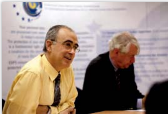
Joaquín Bayo Delgado, helyettes biztos egy értekezleten a munkatársakkal

Ami az európai adatvédelmi biztosra ruházott hatáskört illeti, mindez ideig semmit nem rendelt még el, nem állapított meg tilalmat vagy nem adott ki figyelmeztetést. Mostanáig elegendőnek bizonyult, ha az európai adatvédelmi biztos ajánlások formájában véleményt nyilvánított (előzetes ellenőrzések, továbbá panaszok esetében). Az adatkezelők vagy végrehajtották az ajánlásokban foglaltakat, vagy jelezték, hogy szándékukban áll végrehajtani azokat, és megkezdték a szükséges lépések megtételét. A válaszadás gyorsasága esetenként változó. Az európai adatvédelmi biztos kidolgozta az ajánlások nyomán követésének szisztematikus módszerét.