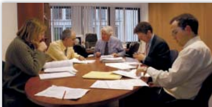
A „policy” csapat néhány tagja egy jogszabálytervezettel kapcsolatos vélemény befejezésén dolgozik

a lehetősége, hogy a bűnüldöző hatóságok számos nagyszabású információs és azonosító-rendszerhez hozzáférjenek. A következő véleményében az európai adatvédelmi biztos támogatta azt az elképzelést, hogy a bűnüldöző hatóságok kizárólag meghatározott körülmények esetén, a szükségesség és arányosság eseti alapú mérlegelését követően kapjanak hozzáférést a VIS-hez. Mindezeket a feltételeket szigorú biztosítékoknak kell kísérsniük. Más szóval a bűnüldöző hatóságok hozzáférést megfelelő technikai és jogi eszközök révén meghatározott esetekre kell korlátozni.